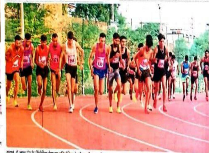
शुक्रन में लाल रंग के सिंथेटिक ट्रैक पर प्रतियोगिता के दौरान दौड़ लगाते युवा।