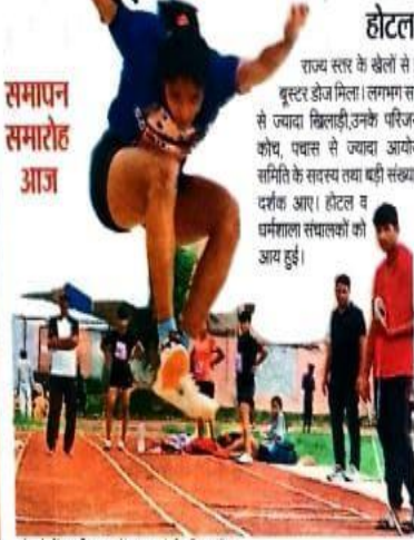
शुक्रन में लम्बी कृद में भाग लेती खिलाड़ी।