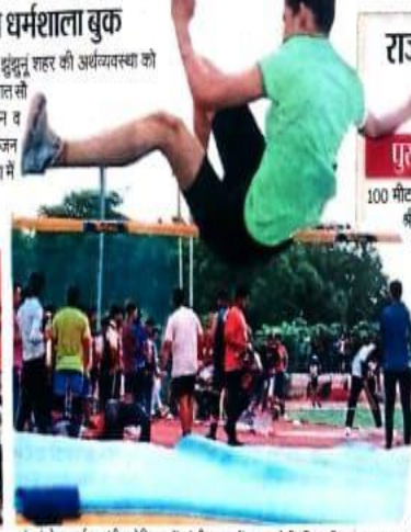
शुक्रन के स्वर्ण जयंती स्टेडियम में जमी कृद में भाग लेती खिलाड़ी।

राज्य स्तर के खेलों से शुक्रन शहर की अव्यवस्था को बुस्टर डोज मिला। लगभग सात सौ से ज्यादा खिलाड़ी, उनके परिजन व कोच, पवास से ज्यादा आयोजन समिति के सदस्य तथा बड़ी संख्या में दर्शक आए। होटल व धर्मशाला संघालकों को आय हुई।