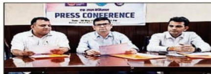
Officials addressing the media

Under the MoU, during national-level champion-